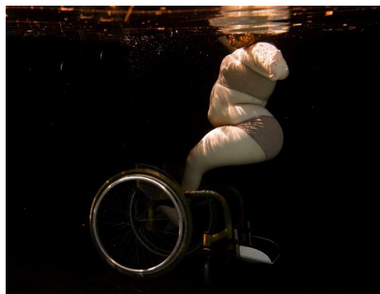
Pintura à óleo: Geo Brandão e Eliene Berto | Fotografia submersa: Gabriela Amorim e Amanda Bambu